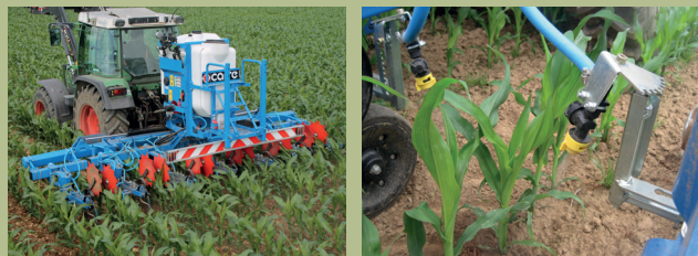
Abb. 2 : Kombiniertes System zum Spritzen in den Reihen und Hacken zwischen den Reihen

B Beim Teilverzicht auf Herbizide dürfen zwischen den Reihen keine Herbizide eingesetzt werden. Die Bandbehandlung darf auf maximal 50 Prozent der Fläche der Parzelle oder der Kultur erfolgen und muss in den Reihen ausgebracht werden. Einzelstockbehandlungen sind nicht zugelassen.