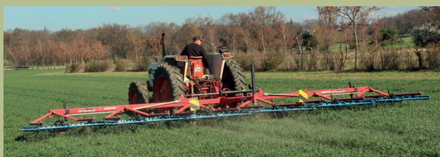
Abb. 1 : Hackstriegel mit grosser Arbeitsbreite

A Beim Vollverzicht auf Herbizide dürfen auf 100 Prozent der angemeldeten Fläche keine Herbizide eingesetzt werden.