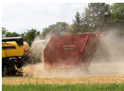
Avec remorque suiveuse