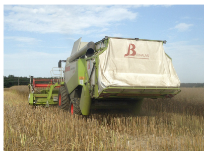
Avec caisson sur la batteuse