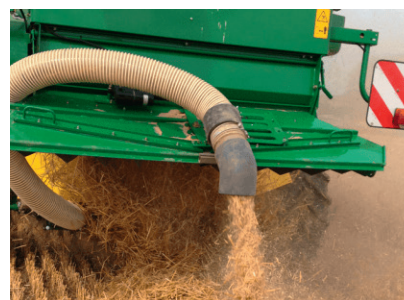
Dépôt de la menue paille sur l'andain